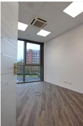
BEISPIEL - Büroraum 2