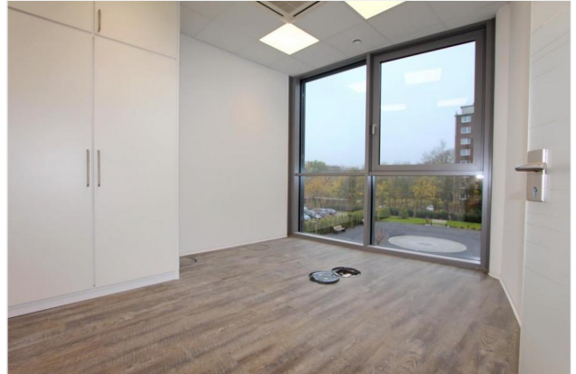
BEISPIEL - Büroraum 1