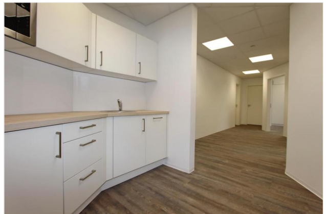
BEISPIEL - Küchenzeile