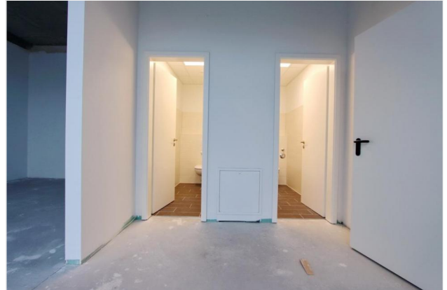
Personal + Sanitär