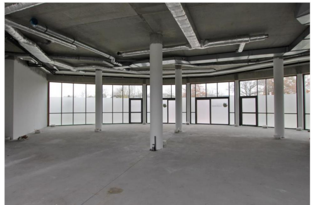
noch zu teilender Raum